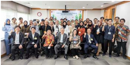
インドネシアでの第5期キックオフセレモニー

2020年度以降はテレワークなどのオンライン活動も導入し、時代に即したプログラム運営を行っています。さらに2019年にはインドネシア・ジャカルタで同様のプログラムを開始し、国際的な人材育成にも取り組んでいます。