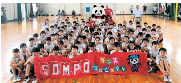
出張ダンス授業の様子

当社は、2019年3月から、小学校の体育授業で必修のダンスを通じて、子どもたちの健やかな成長や運動離れの解消を支援するため、日本ストリートダンススタジオ協会と「SOMPOダンスプロジェクト」を開始しました。足が速くなるトレーニング要素を振付けに含んだ「足が速くなるダンス」を教材として提供し、全国各地で教員向け研修会や、小学校にプロの講師を派遣する特別ダンス授業を開催しています。