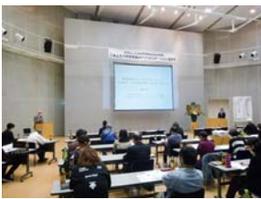
リハビリテーション講習会