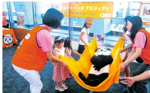
体験型防災ワークショップの様子