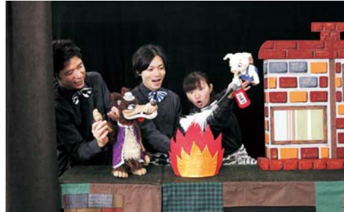
防災人形劇の様子

当社は、災害から身を守るための知識や安全な行動を理解していただくことを目的に、将来を担う子どもたちとその保護者を対象に「体験型防災ワークショップ」および「防災人形劇」を実施しています。近年増加している水害や感染症予防に関する新たなワークショップも展開し、これまでに、約77,000人の方にご参加いただきました(2023年3月末 イベント参加者数に限る)。