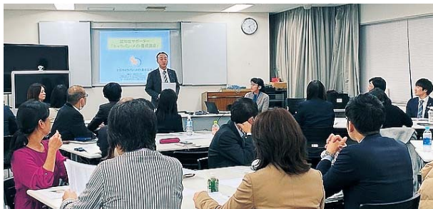
認知症サポーター養成講座