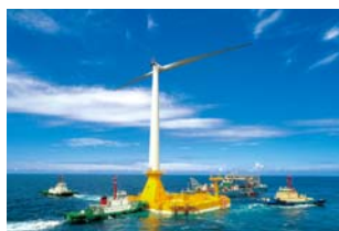
洋上風力発電施設の建設風景

当社は、国内の洋上風力発電事業者を対象に、発電設備の建設・工事期間中だけでなく、操業開始後の自然災害などのリスクも一括して補償する、洋上風力発電事業者向け「ONE SOMPO WINDサービス」を提供しています。また、洋上風力発電設備を取り巻く台風などの自然災害、電氣的機械的事故のリスクを確